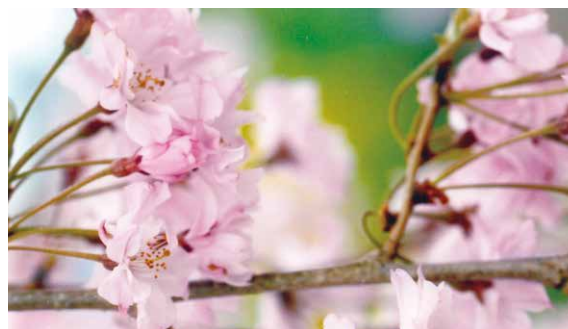
花名：桜 花言葉：優美