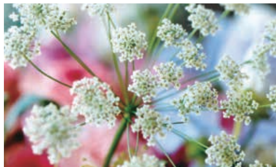
花名：レースフラワー 花言葉：祝福

以上がりハビリテーションで用いる代表的な杖です。杖の種類を変えるだけでその人の歩行能力が大きく変わることは、私もふだん仕事をしていてよく経験することですので、自分に合っているのはどんな杖なのか、杖選びの参考にしてもらえると幸いです。