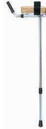
プラットホーム杖