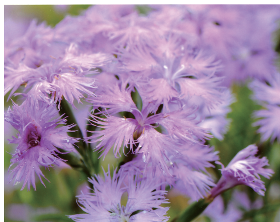
花名：カワラナデシコ 花言葉：可憐、大胆

入院患者さんを中心に口腔ケアの実施、病院に受診することが困難な患者さんの自宅や施設への訪問歯科診療も実施しております。訪問歯科診療の場合、訪問可能な日時など限られてしまうこともありますが、ご希望の際はお気軽にお問い合わせ下さい。