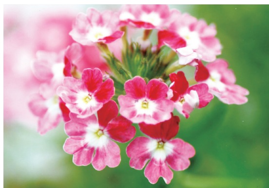
花名：バーベナ 花言葉：家族の和合