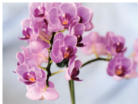
花名：コチョウラン 花言葉：清純、幸福が飛んでくる