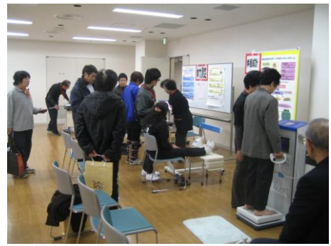
写真：介護予防まつり体力測定の様子

☆今年度の「第5回介護予防まつり in まえばし～ピンシャン！元気で明るいまちづくり」は、 H24.12.2(日) 10:00～ 前橋市総合福祉会館にて開催予定です。