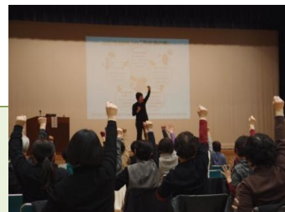
写真：研修会②の様子